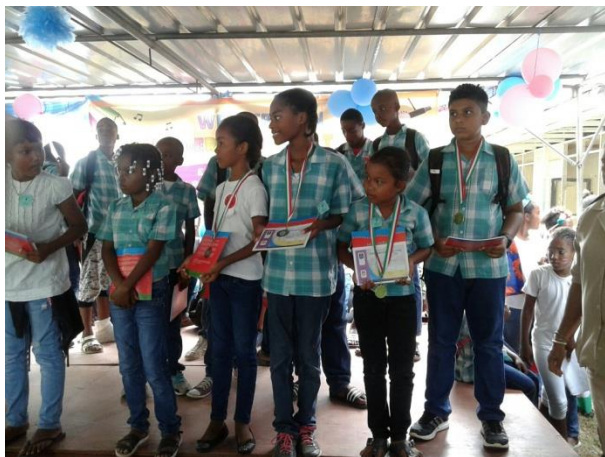
Medaillewinnaars KBF Coronie