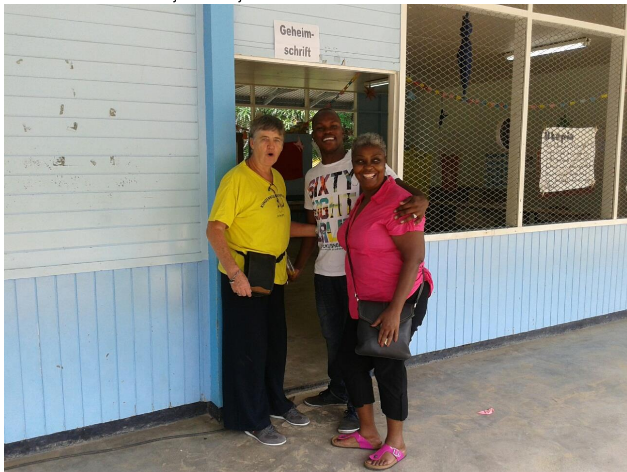
Einde KBF Coronie!