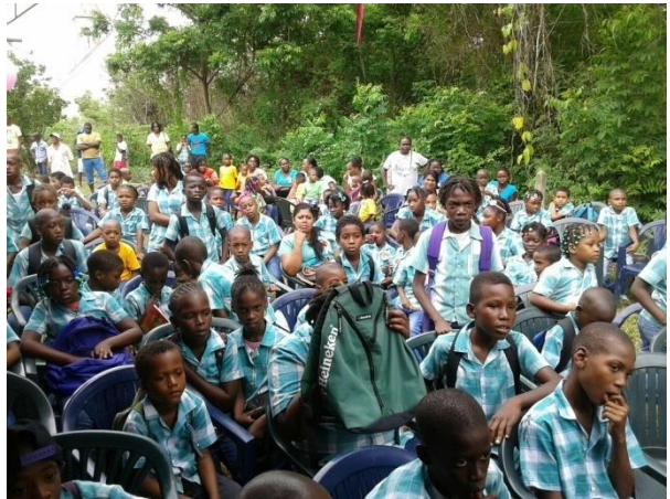
Aandachtig luisterend naar wedstrijdpresentaties