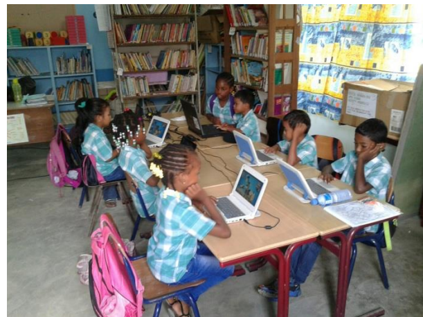
Computeractiviteit op KBF Coronie