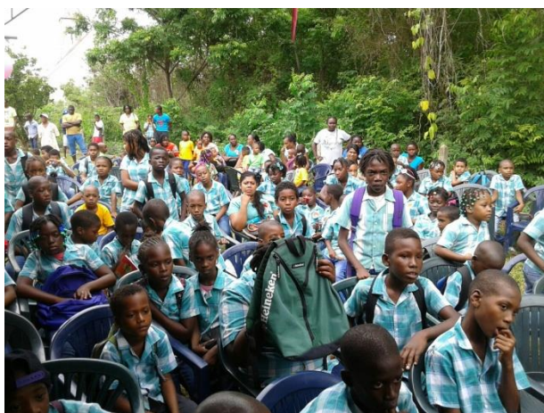
Het publiek geniet van de wedstrijden