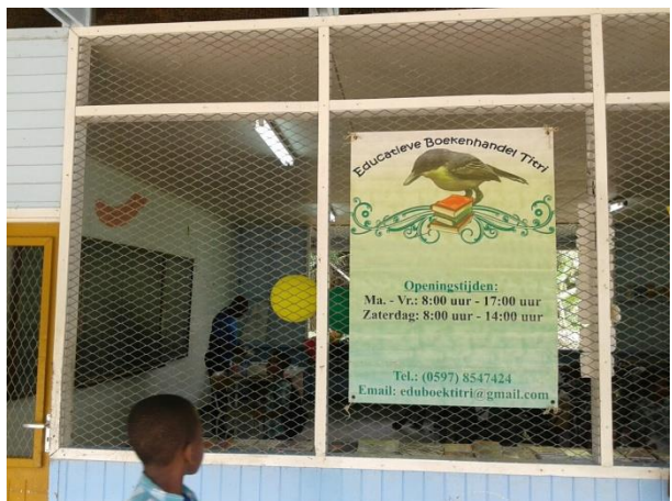
Activiteitsruimte Boekwinkel Titri