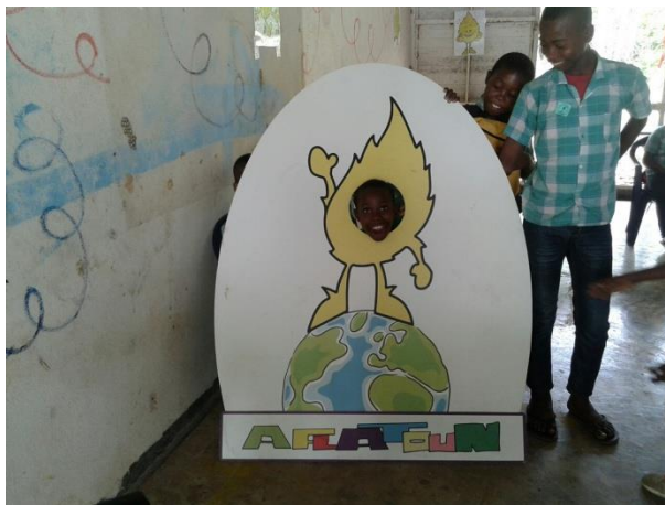
Aflatoon op KBF Coronie