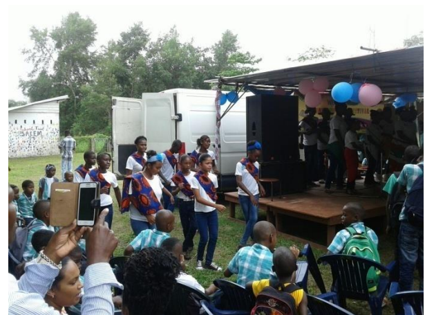
Ook naast het podium werd opgetreden!