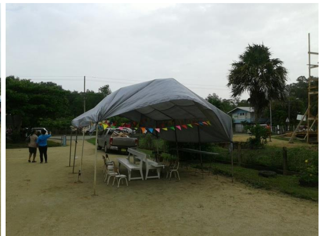
Kindvriendelijke aankleding en inrichting?