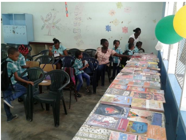
Boekactiviteit in een schoollokaal