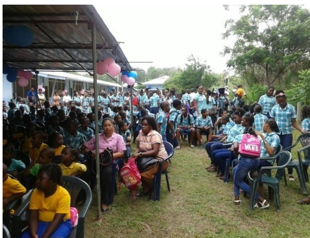
Goddank was het een zonnige KBF-dag!