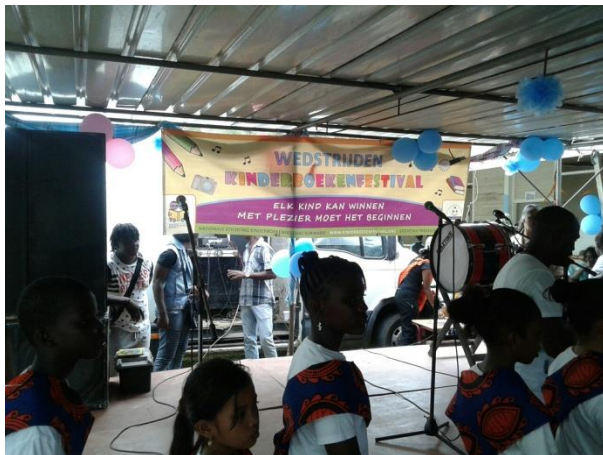
Optreden zang- en dansgroep van OS Totnes