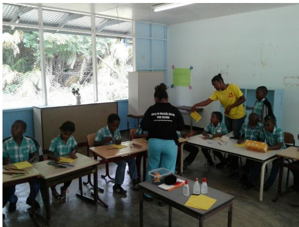
Maak je eigen Aflatoon