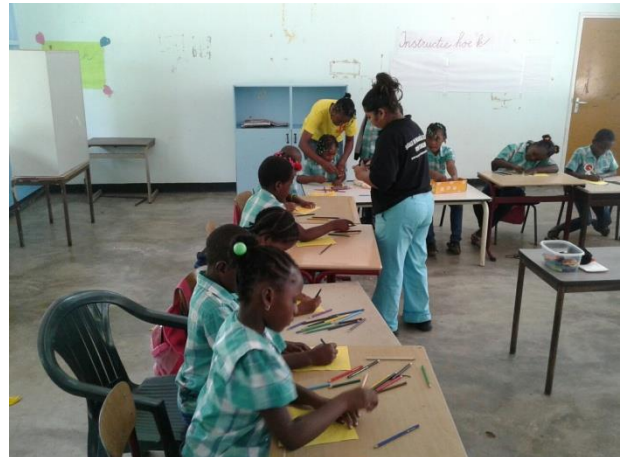
Sociale en financiële educatie