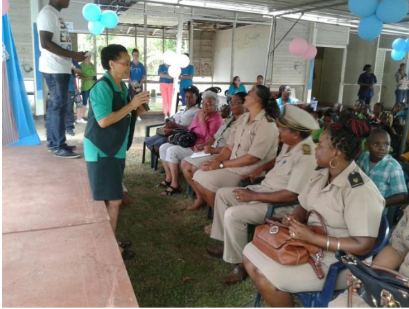
Openingstoespraak namens de KBF Voorzitter