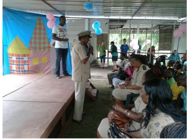
De DC spreekt de aanwezigen toe!