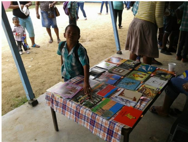
Boekverkoop Stichting Projekten