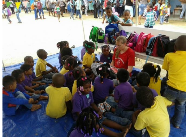
Gezellig luisteren naar een verhaal