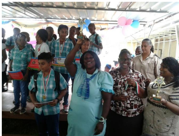
Kampioenstrofeeën voor de scholen