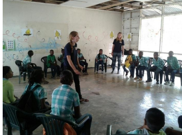
Onderzoek, denk, ontdek en doe!