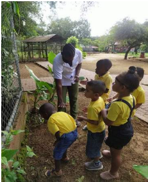
Kinderen leren over planten