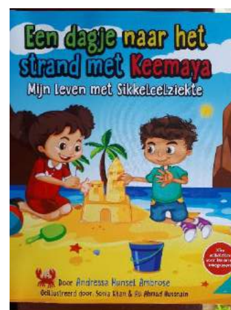
Kinderboeken voor gezondheidseducatie

Educatie komt van het Latijnse woord 'educere', dat opvoeden betekent. Educatie is een overkoepelende term voor vorming, onderwijs en opvoeding binnen een schoolse omgeving of daarbuiten. Educatie betreft hierbij zowel onderwijsmethodes, leerprocessen als de overdracht van de verzamelde kennis, normen en waarden van een samenleving en haar componenten. De betekenis van educatie is het bewust en doelgericht scheppen van voorwaarden en het organiseren van activiteiten en leerprocessen gedurende enige tijd met het oog op het vermeerderen van kennis, het vergroten van inzicht, het verbeteren van meningen en opinies. Vorming is het proces waarbij iemand komt tot het ontwikkelen van een zelfstandig kunnen hanteren van de eigen mogelijkheden in sociale relaties, handelingen en in diverse levenssituaties. Vorming is het bevorderen van kennis, inzicht en vaardigheden van individuen en/of groepen. De opvoeding draagt bij aan de vorming van het karakter, maar vorming geschiedt vooral door onderwijs.