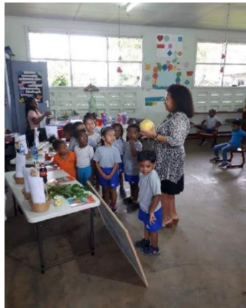
Kinderen leren over fruit

Het Kindereducatiecentrum zal zich erop toelagen om alle kinderen in Suriname te bereiken met educatie en vorming. Er zal gewerkt worden aan bewustwording van normen, ongeschreven regels over hoe je je hoort te gedragen, en aan waarden, de achterliggende idealen die als waardevol worden aangeduid, dingen die we belangrijk vinden als persoon of als groep. Wij hopen hiermee een bijdrage te kunnen leveren aan het terugdringen van normeloosheid in onze samenleving.